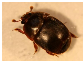
Photo 1 : Petit coléoptère de la ruche adulte

* Définition de la suspicion : présence d'au moins un coléoptère dans un piège placé à l'intérieur de la ruche.